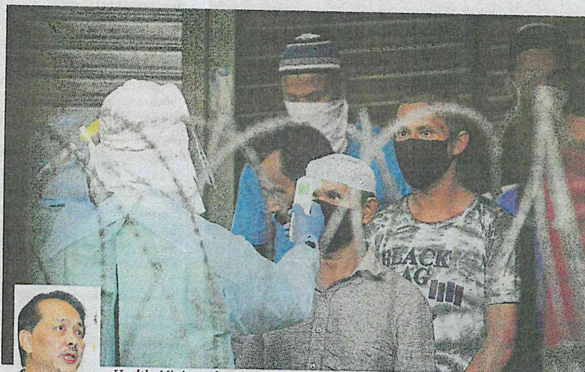
Health Ministry frontliners taking the temperature of residents at the Selangor Mansion flats recently. Foreigners make up most of the residents in the flats. (Inset) Health director-general Datuk Dr Noor Hisham Abdullah.

Apart from the tahfiz group, Dr Noor Hisham said another target