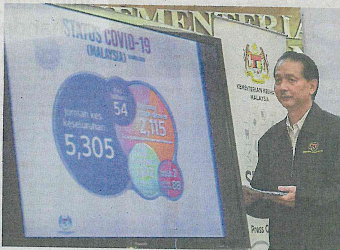
Current situation: Dr Noor Hisham showing the country's Covid-19 status at the Health Ministry in Putrajaya.