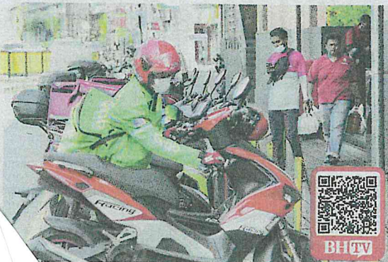
Kementerian Kesihatan mempertimbang penghantar makanan melalui saringan kesihatan.

Putrajaya: Kementerian Kesihatan (KKM) sedang menimbang keperluan untuk semua penghantar makanan melalui saringan kesihatan, sama seperti peraturan yang ditetapkan ke atas penyedia dan pengendali makanan.